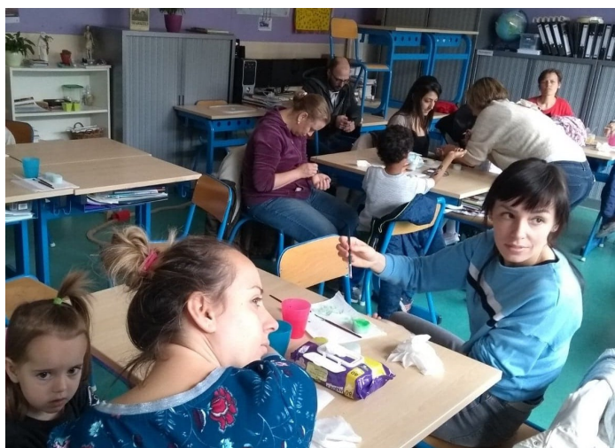
Workshop ouder-kind schminken

Bedankt aan alle helpende handen en de vele aanwezigen!