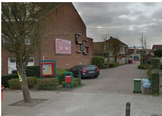
Ingang lagere school

Ouders die een kleuter en een kind uit de lagere school hebben zullen dus de kinderen aan de 2 verschillende ingangen moeten afzetten.